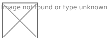
Рис. 5. Анализ ассортимента кожаной обуви магазина Юничел по гендерному признаку в 2018 г.

Итак, основную долю в ассортименте магазина Юничел представляет женская кожаная обувь, хотя наблюдается тенденция к увеличению доли мужской обуви: с 28 % от общего ассортимента кожаной обуви магазина в 2019 году до 31 % в 2018 году (рис. 5 и 6).