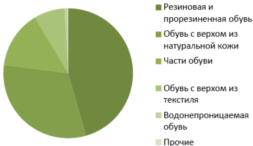
Рис. 2. Структура российского импорта по видам в натуральном выражении

Согласно результатам исследований, доля импортных поставок обуви в Россию в настоящее время составляет 70-80% от совокупного объема продаж. Основным поставщиком обуви в Россию является Китай, на который приходится 75-80% официального импорта обуви, около 9% обуви поступает из Турции, 2% - из Италии. Как отмечают эксперты, в действительности доля итальянской обуви на российском рынке существенно выше, поскольку не всегда она производится в Италии. Среди ближних соседей наиболее крупным поставщиком обуви в Россию является Белоруссия, на которую приходится 3-5% импорта.