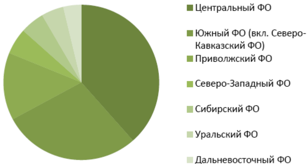
Рис. 1. Структура российского производства обуви по федеральным округам в 2019 г.

Производством обуви в России занимается такие крупнейшие предприятия, как: ООО «Брис-босфор» (Краснодарский край), ООО «Муя продакшин» (Владимирская обл.), ЗАО «Обувная фирма «Юничел» (Челябинская обл.), ООО ТП Компания «Цзисинь» (Приморский край), АО «Торжокская обувная фабрика» (Тверская обл.) и т. д.